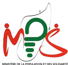
LE MINISTÈRE DE LA POPULATION ET DES SOLIDARITES