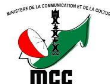
LE MINISTÈRE DE LA COMMUNICATION ET DE LA CULTURE