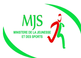
LE MINISTÈRE DE LA JEUNESSE ET DES SPORTS