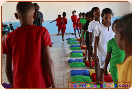
Partenaire financier : donateur privé

Nos partenaires proposent également diverses activités afin d'identifier les enfants vulnérables comme l'activité de « dessin libre » qui donnera l'occasion aux travailleurs sociaux d'avoir une première analyse de leur besoin psycho-social.